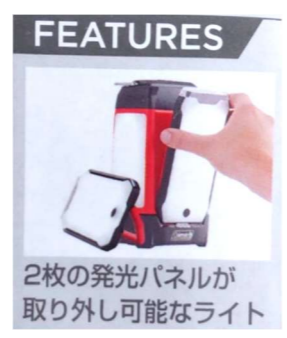
【④2マルチパネルランタン】3つ