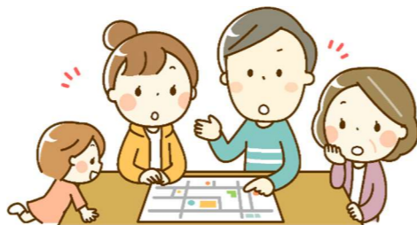
『令和3年度三川内地区防災計画』、12ページ