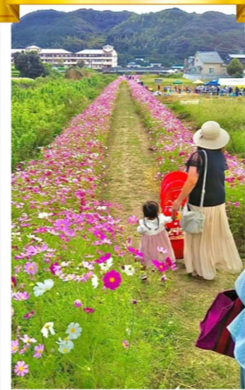
「母娘で初めてのコスモス散歩」 三川内っ子ママ 様