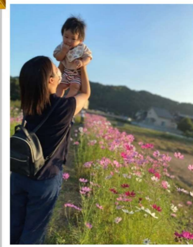
「大きくなーれ！」 Kaa 様