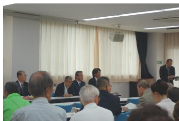
〔公民館まつり実行委員会〕