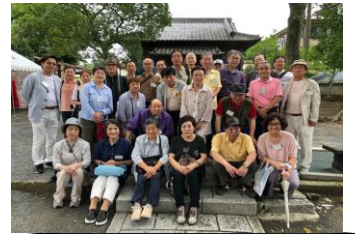
集合写真 はい！チーズ