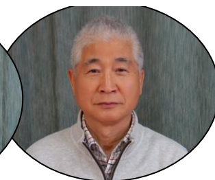
森会計 (宮田町公民館長)