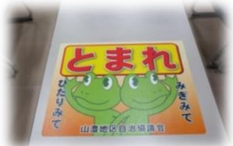
ストップマット配布