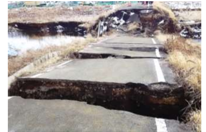
3m程陥没した農道と周辺の田畑