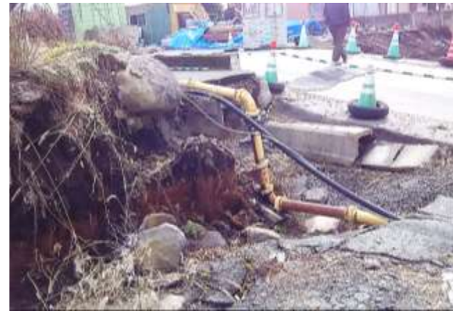
隣接宅地より1.5m下がってしまった宅地（水道管の応急処置）