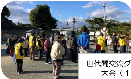
世代間交流グラウンドゴルフ 大会(12月4日)