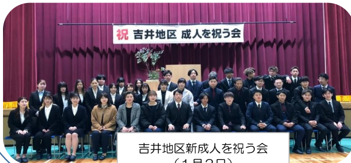
吉井地区新成人を祝う会 (1月2日)