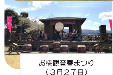
お橋観音春まつり (3月27日)