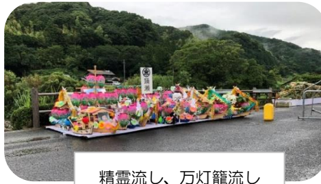
精霊流し、万灯笼流し (8月15日)