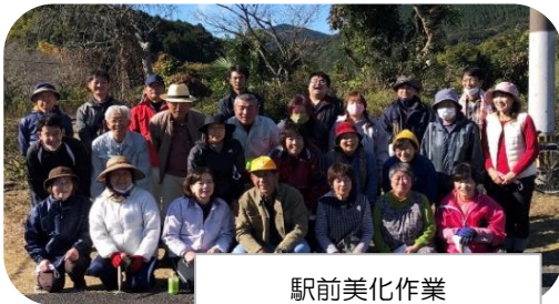
駅前美化作業 (11月28日)