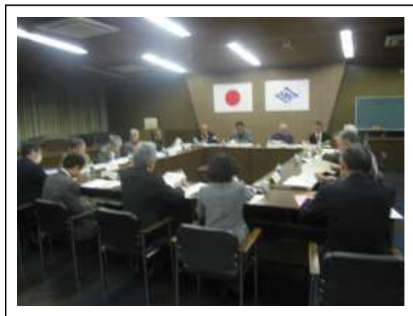
(第 2 回会議の様子)

協議経過については、その都度お知らせしますので、皆さまのご支援とご協力をよろしくお願いします。