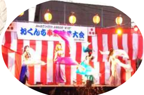
佐世保ベリーダンス舞踏