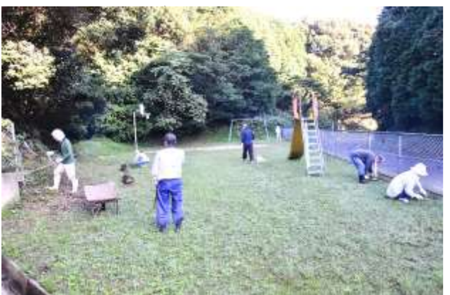
内裏地区清掃模様

10月2日(日) 8:30~佐世保市民秋季大清掃が行なわれました。吉井地区内の各地域において(地域によっては前後に実施された経過がありますのでご容赦下さい。)市民総出で空き缶拾いや、ゴミ拾い、道路や公園等の草刈りに汗を流され、綺麗になり気持ちよい環境となりました。