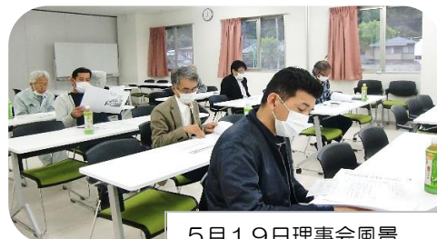
5月19日理事会風景 三密にならないよう気をつけました。

令和2年度の事業で、ふるさとよしい市、吉井地区夏祭り、吉井地区運動会が中止となりました。8月15日のお盆の行事（万灯籠）は実施されますが、灯籠並びに精霊船はせせらぎには流さずコモと精霊船の集積のみ行います。