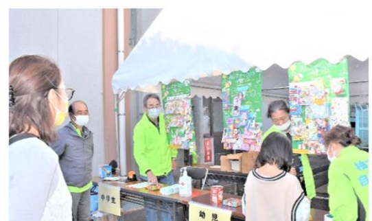
中学生以下の来場者にはくじ引きがありました！