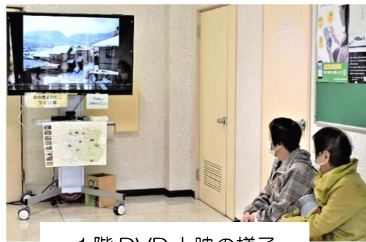
1階 DVD 上映の様子