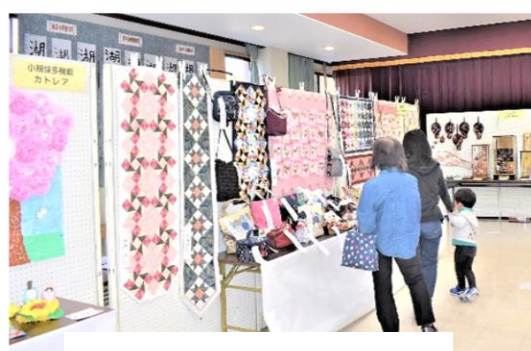
2階講堂・展示の様子