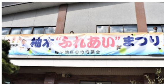
横断幕も『柚木ふれあいまつり』に新しくなりました！