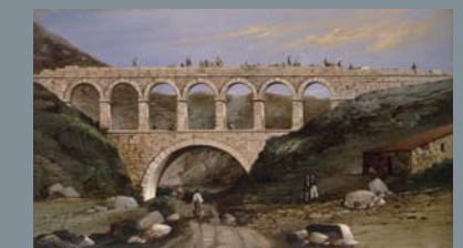
ニコラス・カバニエーロ「イサベル二世運河、ラ・シマの水道橋」1859年

長崎県美術館が所蔵する芸術作品の巡回展「移動美術館 art moving」が本市で6年ぶりに開催。世界の名画や名誉県民表彰作家の彫刻など約30点が展示されます。