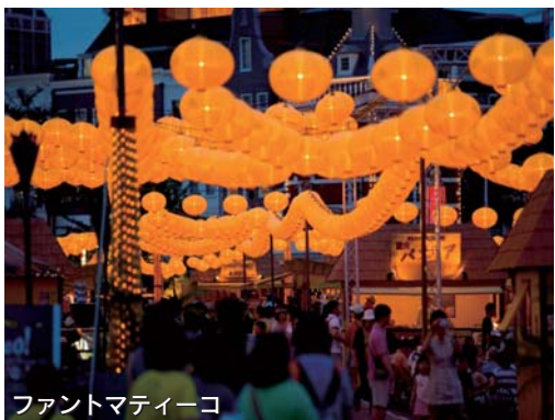
ファントマティエコ