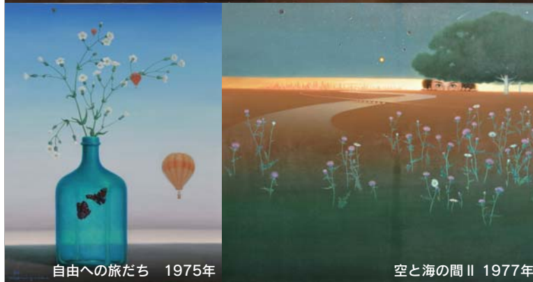
自由への旅たち 1975年