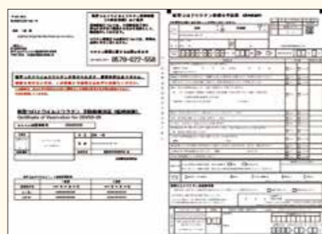
新しい接種券のイメージ

「予診票」には住所や氏名、生年月日などの情報があらかじめ印字されていますので、必要事項を記入の上、接種会場に持参してください。また、「接種券」は予防接種済証も兼ねていますので、切り離さずそのまま持参してください。