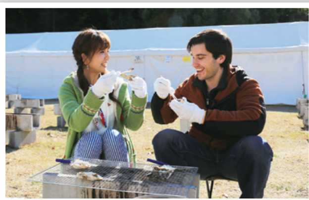
※カキ祭りについては、本紙1月号13ページをご覧ください。