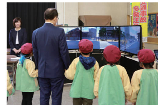
シミュレーター機器を使用し、歩行者目線で道路交通の危険性を体験する朝長市長と子どもたち

親子一緒にゴーカートを楽しまれるなど、交通公園にさまざまな思い出をお持ちの皆さまには大変寂しく感じられていると思いますが、時代の変化に合わせて新しい交通安全学習の場「交通安全学習館」としてスタートいたしましたので、どうかご理解をいただきますようよろしくお願いいたします(ゴーカート場は「えぼしスポーツの里」内にも設置