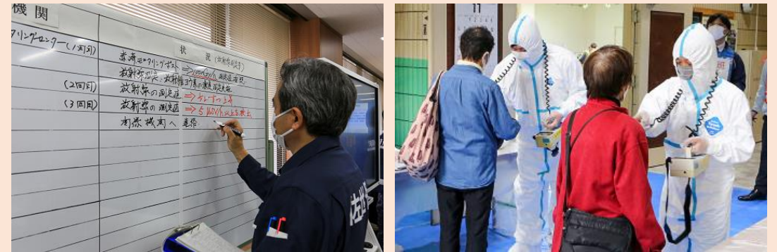
令和4年度の訓練の様子