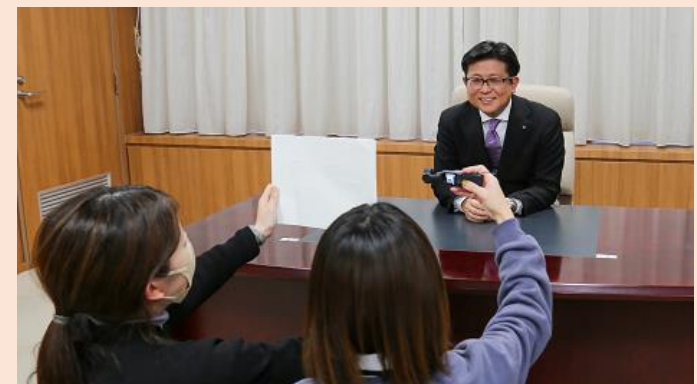
上) サムネイル、下) 初収録の様子