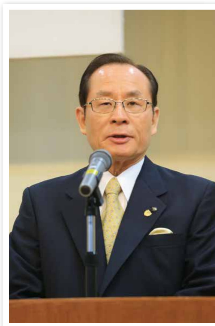
就任式であいさつする朝長市長