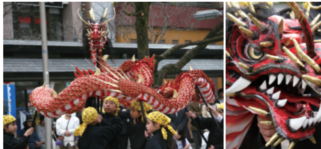
3月19日、担い手不足などから途絶えていた三ヶ町商店街の「こども蛇踊り」が約14年ぶりに復活。島瀬公園など4会場で披露されました。参加した約30人の子どもたちは、東日本大震災の犠牲者を悼んで黙とうした後、自分たちの元気を送りたいと精いっぱい踊りを披露しました。