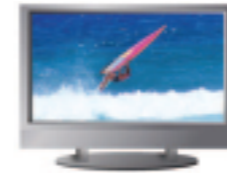
地デジ対応テレビ