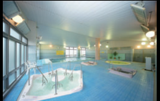
↓水流で体をマッサージする設備なども備えた「健康浴室」