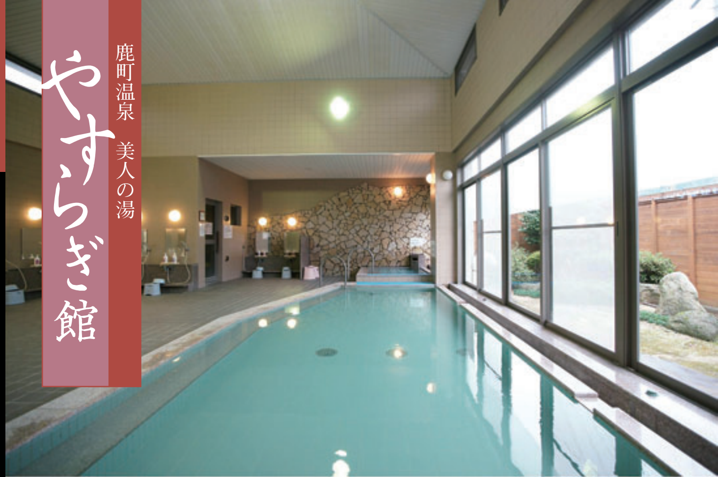
↑豊富な湯量でゆったりくつろげる「大浴場」