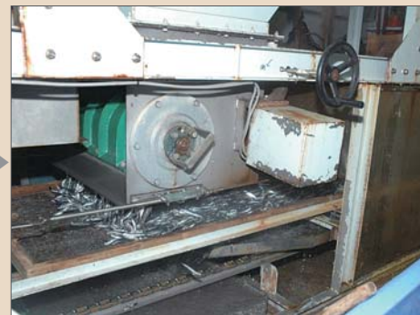
2 自動化された加工場で原料を一定の大きさに選別し、セイロに並べ、海水洗浄します。