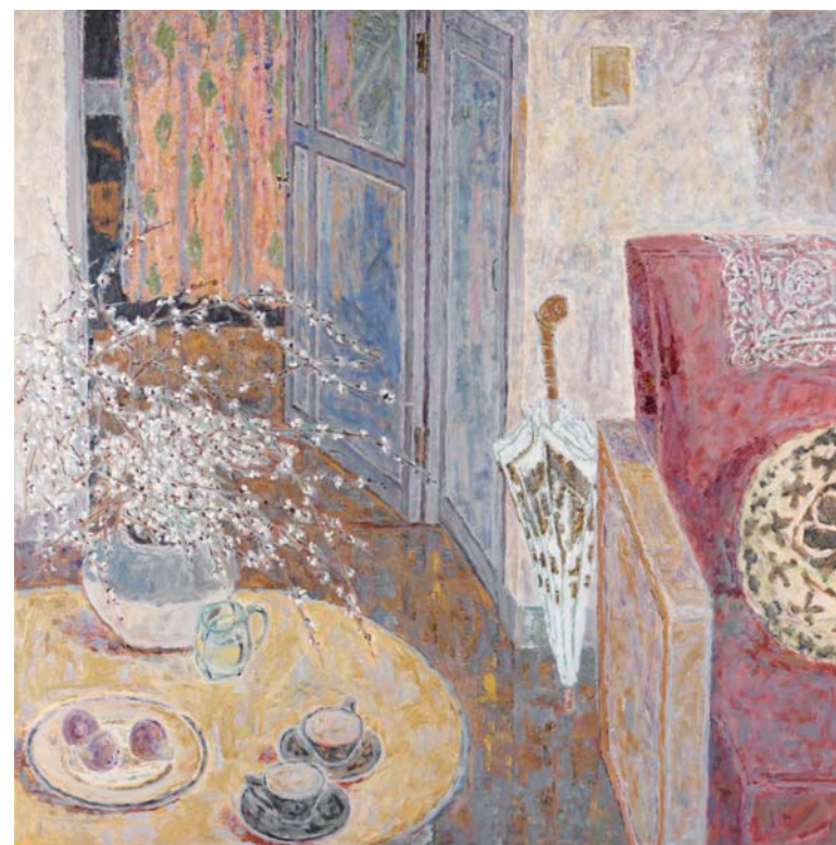
「室内」 昭和30(1955)年 長崎県美術館所蔵