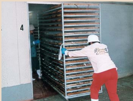
5 釜揚げしたセイロを台車に移し、温風乾燥機で乾燥させます（約7°Cの魚で約24時間）。