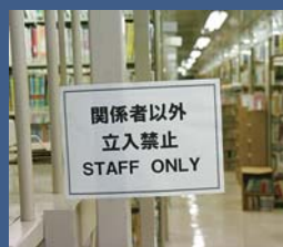
この先は「図書館探検ツアー」で!

宮地町3-4 ☎22-5618 開館時間=10時～18時(金曜は一般室のみ10時～20時) 休館日=月曜、祝日(月曜の場合は翌日も)、月末(月曜の場合は前日も)。早岐・相浦・世知原・宇久地区公民館図書室も同様。