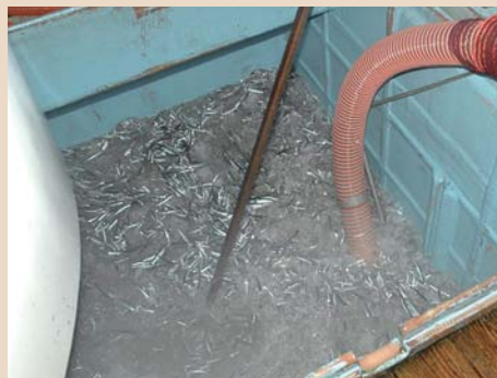
1 船から加工場へ、原料（イワシなど）をポンプで直接運び入れます。