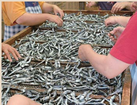
6 乾燥後、手作業で海藻などの異物を除去し、魚の種類、大きさごとに選別します。