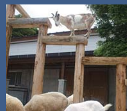
ヤギの習性が学べる足場が完成

船越町2172 ☎28-0011 開園時間=9時～17時15分 入園料=高校生以上400円、中学生以下100円(保護者が同伴する6歳未満の幼児は無料) ※市営バス一日乗車券利用の場合は2割引。