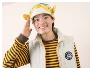
さかなクン © 2008 AMW 監製

来夏の新水族館オープンに向けた改修工事のため、パールシーセンター休館前の最後の営業日となる8月31日(日)に、テレビ等で活躍中のさかなクンがやってきます!