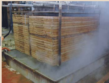
4 セイロは煮釜（約95度の海水）へ入れます。魚の大きさによって5~10分程度ゆでます。