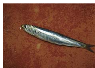
カタクチイワシ 長崎地方では「タレ」「エタリ」とも呼ぶ。沿岸のものは背が白く、沖合のものは背が青黒いという特徴があります。

小佐々と言えは「いりこ」を思い浮かべる人も多いと思いますが、中には「いりこ」という魚が海を泳いでいる」と思っている人はいませんか？ いりことは、イワシやアジ、サバの稚魚などを煮て乾燥させたものをいいます。いりこは主に西日本方面での呼び名ですが、地域によって「じゃこ」「だしじゃこ」など、呼び名はさまざまです。一般的には「煮干し」と呼ばれていますが、ちなみに、2月14日は「(2)ぼ(1)し(4)」の語呂合わせから、全国煮干協会の「煮干の日」として使われます。この中でもカタクチイワシで作られたいりこは、魚臭が少なく、コクのあるだしが出るため、原料として最も多く使われています。小佐々いりこもカタクチイワシを主な原料としています。