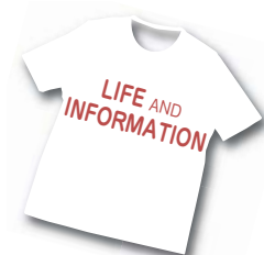
市役所各課へは代表番号☎24-1111からおつなぎします。

け、警察から「事故証明書」をもってらってから、国民健康保険課で申請を。 ※飼い犬にかまれた場合や傷害の場合も申請が必要。