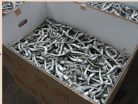
6 乾燥後、手作業で海藻などの異物を除去し、魚の種類、大きさごとに選別します。