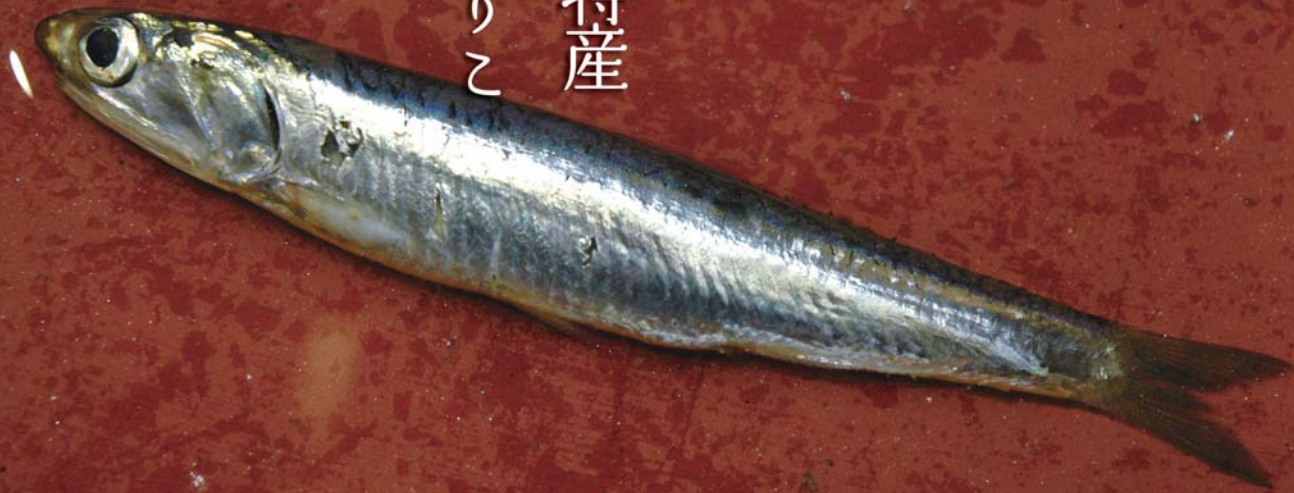
◎いりこの原料となる「カタクチイワシ」。