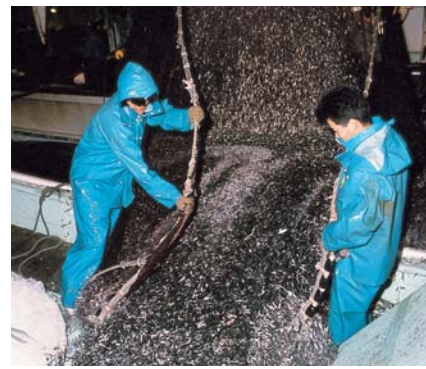
水水が入った運搬船に積み込まれる カタクチイワシ