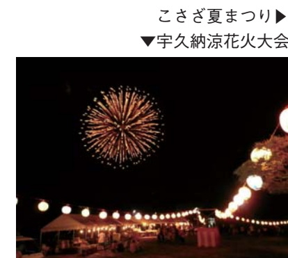
こさざ夏まつり ▶ ▼ 宇久納涼花火大会