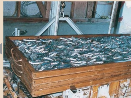
3 セイロは20段に重ねます。