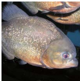
ピラニアナッテリー

西海パールシーセンター休館前の最後の特別展として、これまでに開催した特別展(40回開催)の中から、ミズオオカゲやピラニアなど、飼育スタッフが押す生き物たちを展示します。とき=7月19日(土)～8月31日(日)9時～18時 ところ=同センター2階特設会場 ※箱やフォトフレームなどを貝殻や漂着物で装飾する「夏休み工作教室」も開催。