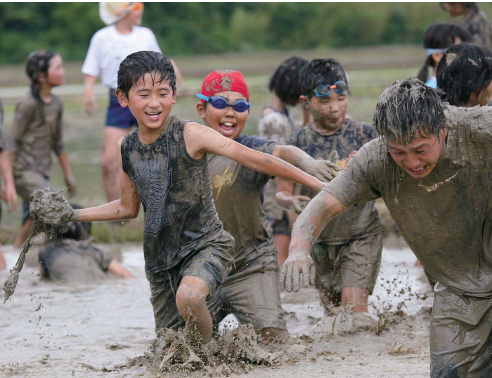
◎これも田植えの前の大事な作業。「泥んこ体験」で全身泥だらけになって、体で「代(しろ)かき」をする江上小学校の児童（6月4日撮影）。