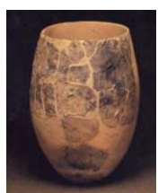
豆粒文土器（泉福寺洞窟）

さらに二年以上もさかのぼった旧石器時代にも佐世保には人が住んでいたことが、市内各地で発掘された遺物（島瀬美術センターに展示）から知ることができます。