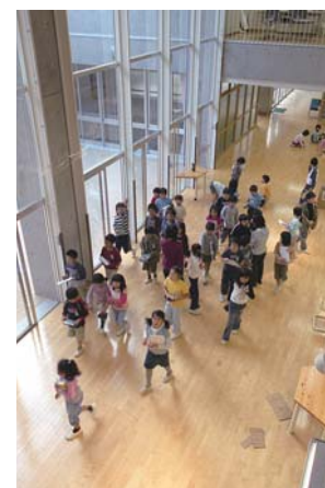
清水小学校の内部

本市では子どもたちの豊かな心をはぐくみ、確かな学力の向上を図るため、従来からさまざまな取り組みを実施していますが、今回は施設整備の面が評価されたものと思ひます。今後とも、心豊かな佐世保っ子育成を目指し、学校施設の整備をはじめ教育環境の充実に努めていきます。