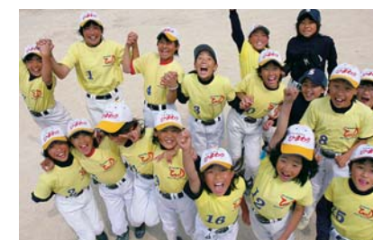
佐世保ひまわりソフトボール部の選手たち

また、3月28日から30日まで静岡県で開催された「第1回春季全日本小学生女子ソフトボール大会」では、「佐世保ひまわりソフトボール部」が優勝の栄冠に輝きました。