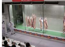
と畜場のせりの様子

とき 8月6日(水)13時~17時 ところ 市食肉センター(干尽町) 対象 小学5年~中学生と保護者 定員 先着15組30人 参加料 無料 申し込み 7月15日(火)からファクス(33-5846)かEメール(syokun@city.sasebo.lg.jp)で、住所、氏名(保護者も)、性別、学年または年齢、電話番号を食肉衛生検査所へ 締め切り 7月23日(水)必着(参加者には郵便にて連絡) ☎食肉衛生検査所 ☎33-5843