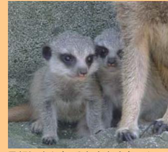
母親に守られてすくすく育つミーアキャットの子どもたち(2月生まれ)

※いずれのイベントも九十九島CLUB会員は優待あり。また「九十九島海物語」の①～⑦は、大人1人につき未就学児1人無料。