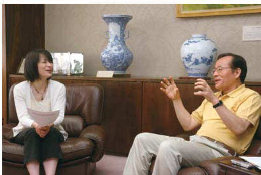
よっしい 情報番組「はっぴいモーニング」(毎週月曜～金曜、7時～8時55分)、バラエティー番組「はっぴい羅針盤」(毎週火・木曜、12時～13時55分)を担当。「はっぴい!FM」開局当初からパーソナリティを務める。

「はっぴい!FM」は昨年7月22日、佐世保に開局したコミュニティFM。コミュニティFMとは、地域限定・地域密着型の放送局。周波数は87.3MHz。毎日生放送でフレッシュな情報を伝えるとともに、災害時の情報提供も行う放送メディアです。放送時間は7時～23時。 http://happyfm873.com/