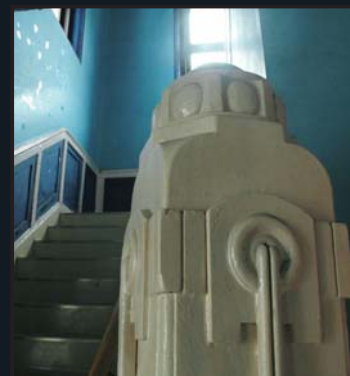
「市民文化ホール」の階段