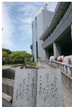
市立図書館の外観