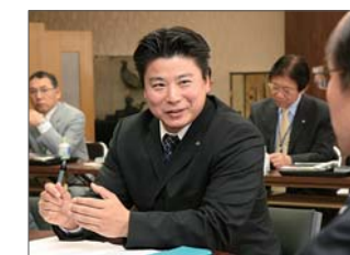
市長と意見を交わす前回の参加者