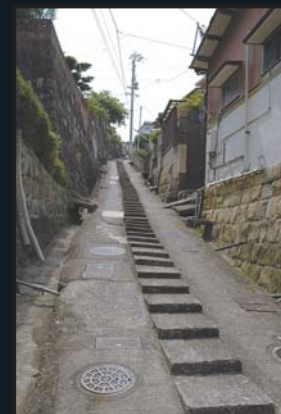
「平戸往還」峰坂町の急坂