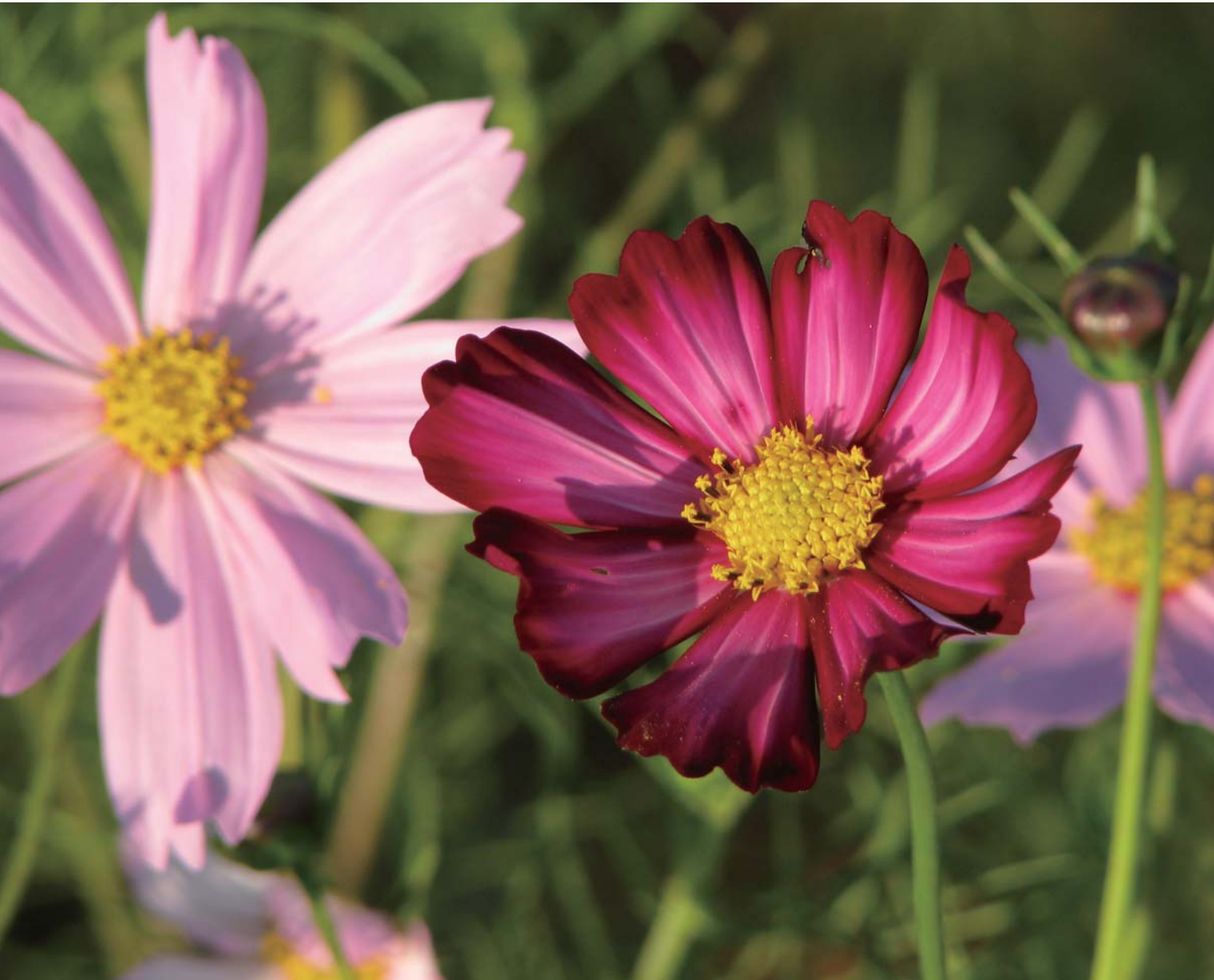
◎色鮮やかに咲く展海峰の「コスモス(秋桜)」。平成19年10月2日撮影。