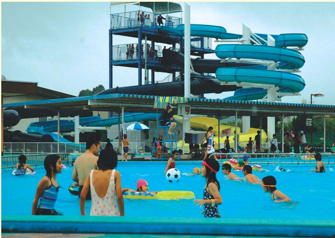
総合グラウンドプールオープン初日、初泳ぎを楽しむ来場者