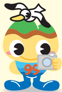
広報させぼ 編集長 「キューちゃん」