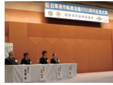
横須賀、呉、舞鶴、佐世保の4市長が出席して開催された「旧軍港市転換法施行60周年記念式典」(5月22日、舞鶴市)

佐世保は明治二十二年に旧日本海軍の佐世保鎮守府が設置され、これより海国日本の国防を担う軍港として発展していくことになります。鎮守府の開設により、海軍工廠(軍需品