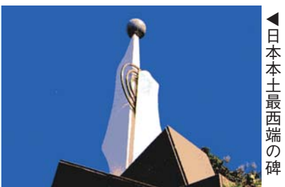
日本本土最西端の碑

「佐世保検定」の問題から抜粋した「ミニ佐世保検定」です。問題は全部で50問あります。30問以上正解で「ブロンズ」、40問以上正解で「シルバー」、45問以上で「ゴールド」に相当します。皆さんも挑戦してみませんか。