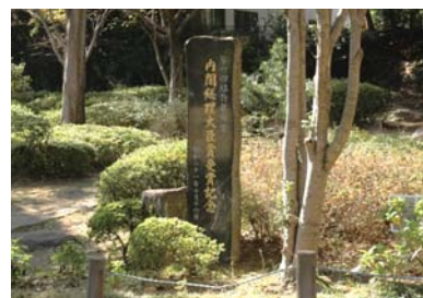
緑の都市賞記念碑

問22 五島列島の福江島には盆行事として行われている「チャンココ」という念仏踊りがあり、県の無形民俗文化財に指定されていますが、この「チャンココ」は宇久島から伝わったといわれています。この「チャンココ」の原形で、市の無形民俗文化財に指定されている念仏踊りはなんでしょうか。 ①オーモンデー ②クアインココ ③なぎなた踊り ④しゃぐま棒引き