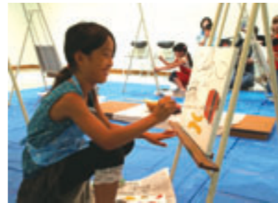
昨年度の油彩画教室の様子

時8月7日(土)、8日(日)14時～16時 内ミラーフィルムを使って魅力的な顔を油彩画で描く 対小学3年～中学生で、両日とも参加できる人 定各日20人 料1,000円