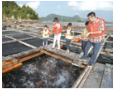
エサやり体験の様子

7月17日(土)から9月20日(月・祝)まで、九十九島を舞台にさまざまなイベントを開催。時間や料金など詳しくはお尋ねいただくか、同リゾートホームページをご覧ください。