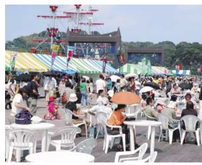
昨年の九十九島の祭典