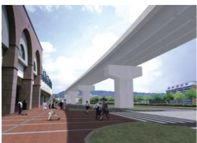
高架橋の整備イメージ

このほか構造を単純にし、無駄な装飾を排除するなど、整備コストの縮減も図られ、インターチェンジ周辺では、周囲の自然環境や緑豊かな街路空間に配慮した緑化事業などが施されます。