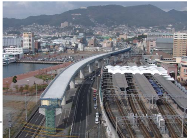
佐世保駅周辺の整備状況