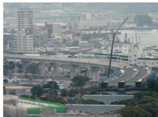
佐世保中央IC周辺の整備状況