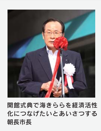
開館式典で海きららを経済活性化につなげたいとあいさつする朝長市長