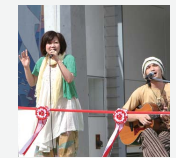
水族館のテーマソング「海きらら」を歌うサンディトリップのお二人