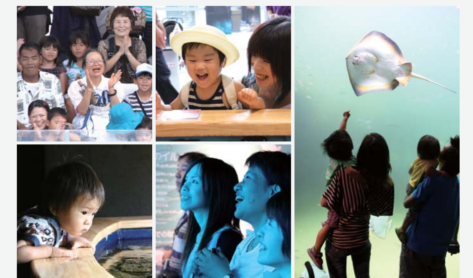
水量650トンの九十九島湾大水槽など海きららのさまざまな施設を楽しむ入館者の皆さん