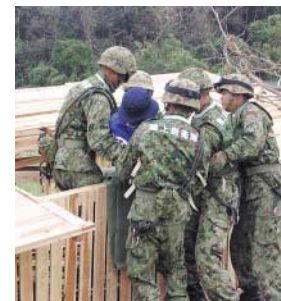
倒壊家屋からの救出訓練

市民の皆さんが中心となる初期消火や応急処置訓練のほか、地震などによる倒壊建物からの救出や海上における遭難者の救助や船舶火災の訓練などを行う予定です。