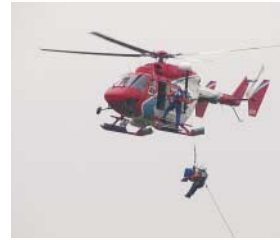
高所人命救助訓練

いつ襲ってくるか分からない災害ですが、万一起きたときに一人ひとりが適切な行動をとることによって、被害を最小限に食い止めることができます。