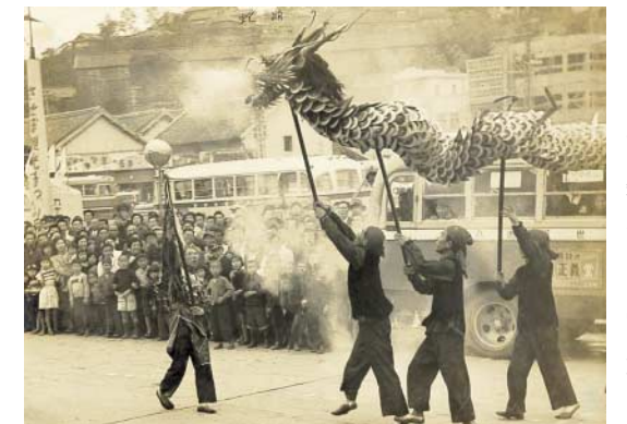
昭和30年に佐世保駅前で開催された「させば観光まつり」風景

「させば観光まつり」が開催された場所は、現在、新駅舎前のタクシー乗り場になっています。駅周辺は再開発され、今ではすっかり近代的な街並みへと様変わりしました。見物客の前列に立っている当時の子どもたちも、現在50歳代後半から60歳代の大人になっていることでしょう。