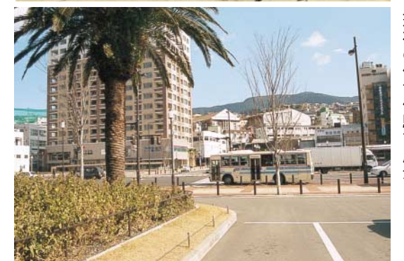
現在の佐世保駅前風景

【懐かしい佐世保の写真をお寄せください】 写真にまつわるお話と住所、氏名、電話番号を書き、「思い出の一枚」担当あてと明記してください。