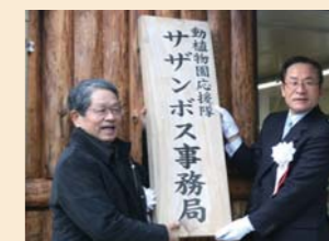
1月に新設された事務局の落成式の様子

きる人、来園者を楽しませる活動に意欲がある人などです。住所・年齢・性別は問いません。 ※申し込み方法など、詳しくは同園内事務局へお尋ねください(☎28-0011)。