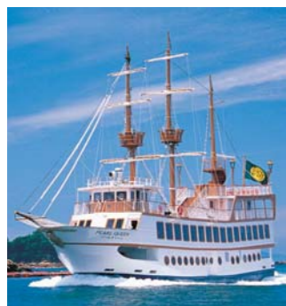
九十九島遊覧船「パールクイーン」

西海パールシーリゾートは、ことしで開業15周年を迎えます。これを記念して、この紙面を九十九島遊覧船券窓口で提示すると、1家族1回に限り遊覧船「パールクイーン」や海賊船「海王」に割引料金で乗船できます 時 3月31日(火)まで 料 中学生以上800円(通常1,200円) 小学生以下400円(通常600円) ※未就学児は大人1人につき1人無料。