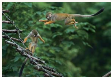
昨年の最優秀賞「鬼ごっこ」