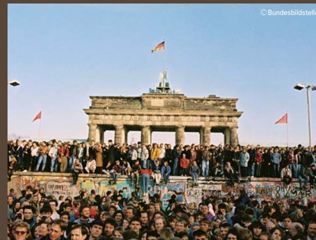
「壁の崩壊から統一へ」 89年11月、ベルリンの壁の上で分断の終わりを共に祝う東西の市民たち