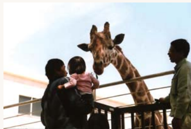
昨年の最優秀賞「餌やり体験」