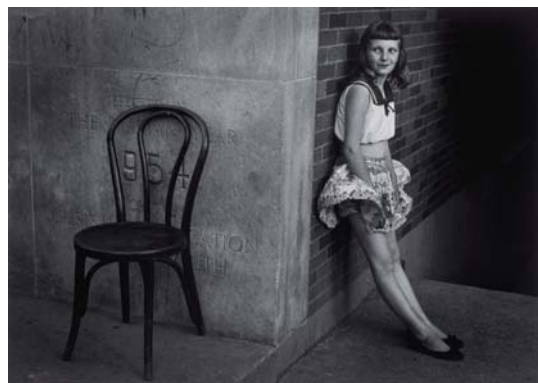
シカゴ 子供 1959-61 ©高知県

優れた造形感覚と知的で美しいモノクロームの表現が、国際的に高い評価を受けている写真家、石元泰博。本展は、「シカゴ」「東京」「桂離宮」「伊勢神宮」「シブヤ、シブヤ」などの代表作を中心としたオリジナルプリント約150点と映像作品、カメラなどをご覧いただけます。