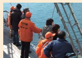
乗船ガイドの様子

募集期間 4月1日(水)~30日(木) ※応募方法など詳しくは同リゾート内・九十九島ボランティアガイド事務局へお尋ねを(☎28-4187)