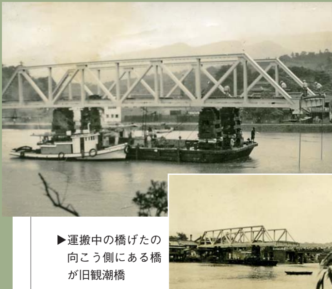
▶運搬中の橋げたの向こう側にある橋が旧観潮橋

懐かしい佐世保の写真を募集 写真にまつわるお話と住所、氏名、電話番号を書き、「思い出の一枚」担当あてと明記してください。お借りした写真は、郵送でお返しします。