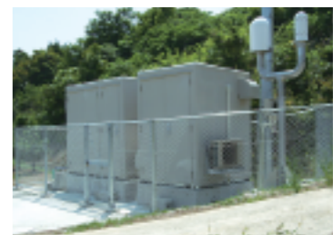
市内に設置されているモニタリングポストの一つ

回答 生活環境の中にある放射線量の監視・測定は、本県の場合、長崎県が実施しています。五島、対馬、大村市、松浦市鷹島の4カ所で測定されており、調査結果は①環境放射線等モニタリングデータ公開システム(五島・対馬) ②長崎県環境保健研究センター(大村市) ③環境防災Nネット(松浦市鷹島)の各ホームページで見ることができます。