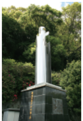
佐世保空襲犠牲者慰霊塔(中央公園内)

佐世保空襲死没者追悼式 時 6月29日(木)10時開式 場 市民会館・集会室A ※10時に市内全域でサイレンを鳴らしますので、黙とうをお願いします。 問 市民生活課 ☎24-1111