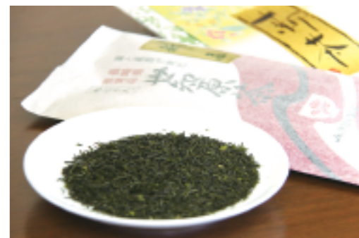
提供：ながさき西海農協世知原製茶工場 ☎76-2064

5月号の答え ①九十九島 ② ③ありません 4月号の応募状況 182通(正解173通・不正解9通・無効0通) はがき137通・Eメール45通