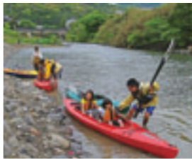
昨年度の入賞作品

道路安全と届け出のお願い 市道の照明灯が消えているとき↓ 土木政策・管理課へご連絡を▽市道に穴が開いているとき↓道路維持課へご連絡を▽道路の占用(足場や看板の設置など)、河川の占用(橋の設置など)、道路の改造(乗り入れ口の歩道切り下げなど) ↓土木政策・管理課へ届け出を 土木政策・管理課、道路維持課 佐々川フォトコンテスト写真・標語展の開催 応募作品、入賞作品を巡回展示します ① 市役所 ↓ 12月20日～1月7日、世知原行政センター ↓ 1月11～21日、吉井行政センター ↓ 1月24日～2月4日、江迎行政センター ↓ 2月7～18日 環境保全課内・佐々川をきれにする会 ☎26・1787 奨学金の返還はお早めに 返還金は後輩の新たな奨学金になります。貸与を受けていた人は、返還期日を守り、早めに納付を。 長崎県育英会、長崎県交通遺児