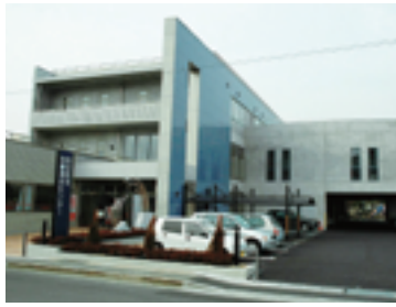
市労働福祉センター

働く市民の福祉の増進と文化教養の向上を図るための施設で、大・中・小の会議室や和室があります 開館時間 9時～22時 場所 稲荷町2の28 休館日 月曜、年末年始 使用料など、詳しくはお尋ねください。