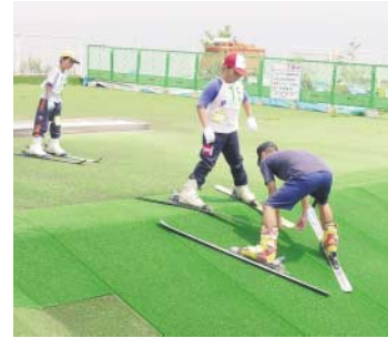
児童文化教室と少年科学教室

えぼしスポーツの里のスキー教室 えぼしスポーツの里 ( ☎ 24669 ) とき 4月~来年3月の第1、3土曜10~14時 対象 小、中学生 参加料 1回千円 (スキーレンタル料込み) 通常の利用よりお得です 定員 先着各30人