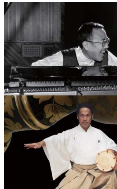
山下洋輔(上)と大倉正之助(下)

世界的なJAZZピアニスト・山下洋輔と、大倉流大鼓奏者として世界各国の式典やイベントで演奏を行う大倉正之助。世界的に活躍する2人の「異種格闘技(コラボレーション)」が実現します。息をつく暇もない緊張感が生み出す、至高のパフォーマンスにご期待ください!