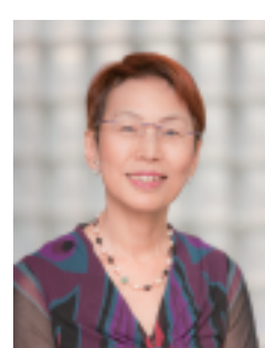
上野千鶴子さん

時 6月25日13時30分～15時 場所 アルカス SASEBO 内 講師 上野千鶴子さん(社会学者・NPO法人ウィメンズアクションネットワーク ワーク理事) ●定員 350人 ●無料(入場整理券が必要) ●5月30日9時～6月14日17時にスピ力で入場整理券を配布 ※託児あり(定員15人、要予約)。 ●男女共同参画推進センター「スピ力」 ☎23・3828