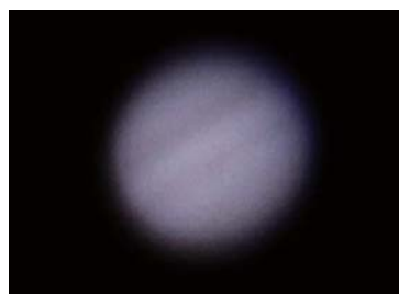
木星の様子(11月2日、少年科学館で撮影)