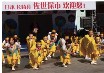
オーシャンローズ号船内(写真上)や、上海市の呉江路休閒街(下)でYOSAKOI演舞を披露する「さくらCity 403遊歩隊」と「蓮風雅」の混成チームの皆さん