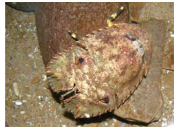
展示予定のソウリエビ

「海きらら」に小学校が出現!? 校長室や理科室、保健室にいるのはどんな魚かな？ ちょっと変わった展示で魚を楽しく観察してみませんか。