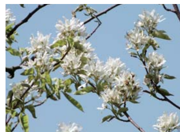
サイフリボクの花

西海パールシーリゾート内の「うみかぜ広場」をガイドと一緒に散策。子どもも高齢者も楽しめる緩やかな道のりです。