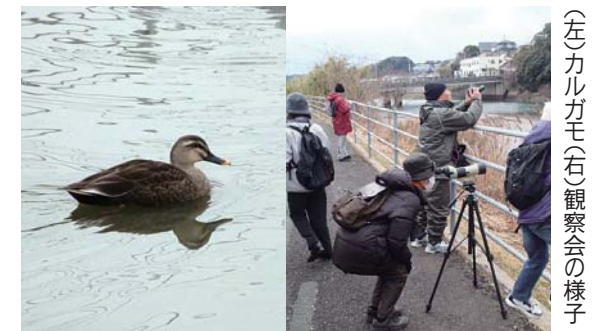
(左)カルガモ(右)観察会の様子

企画展示「九十九島の野鳥展～九十九島と鳥の不思議な関係～」の関連企画第2弾。自然豊かな九十九島周辺には多くの野鳥が飛来します。企画展示の中で野鳥を紹介し、九十九島に注ぐ相浦川で観察会を行います。