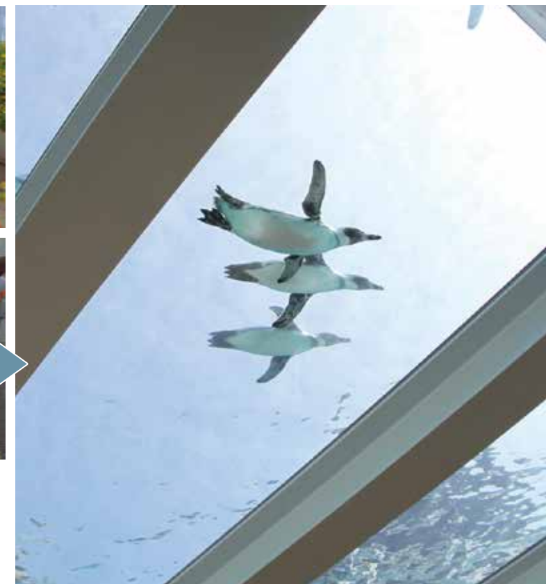
(上) 飼育スペースに向かうペンギンたち (下) プールを前に緊張している様子 (右) 新しい環境に慣れ、気持ち良さそうにプールを泳ぐペンギンたち