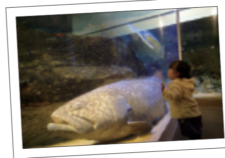
「女の子とタマカイ」

西海パールシーリゾート内で、4月1日⑩から5月31日⑩の期間に撮影した楽しい写真を募集します。入賞者には、40型デジタルテレビや5万円分の旅行クーポン券など豪華賞品をプレゼント! 多くの皆様のご応募をお待ちしています。