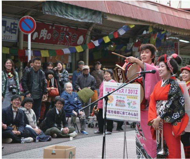
美しき天然（作詞 武島羽衣 作曲 田中穂積） 田中穂積が佐世保海兵団軍楽隊長時代に佐世保女学校（現佐世保北高）の愛唱歌として作曲。後にサーカスやチンドン屋で演奏されるようになりました。

時代を超えて受け継がれる名曲に、世代を超えて聴き入る人々の姿が印象的な秋の一日でした。