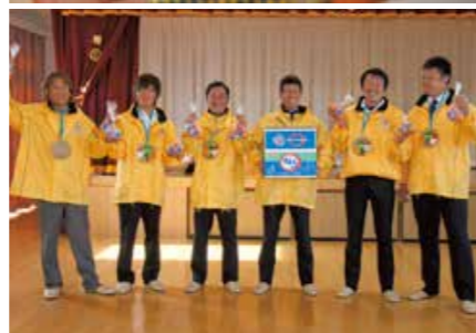
JAながさき西海(味っ子研究会) ☎27-1230